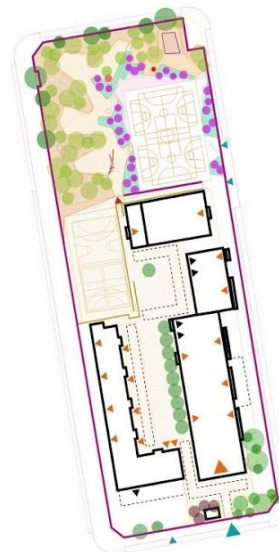
Croquis final. Se amplia la propuesta en posteriores imágenes.